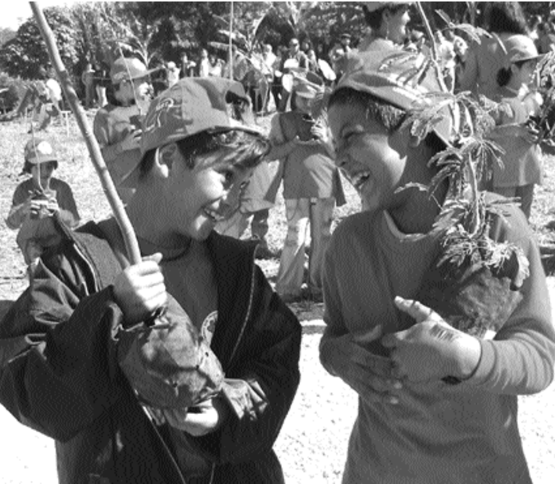
Niños de un asentamiento del MST participan en la siembra de árboles, Brasil Verónica León