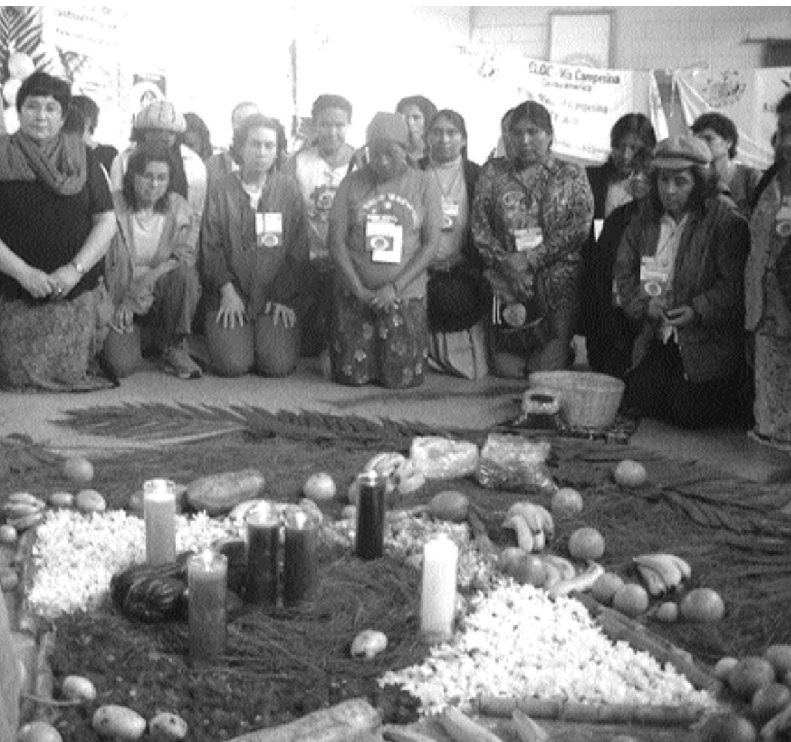
Ceremonia maya en la apertura de la III Asamblea Continental de Mujeres del Campo (CLOC), Guatemala 2005.