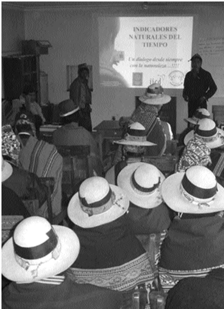
Comunidades bolivianas comparten conocimientos con el apoyo de presentaciones gráficas AGRECOL