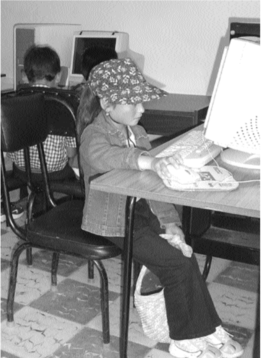
Telecentro de Pucará, Azuay, Ecuador Pastoral Social de Cuenca