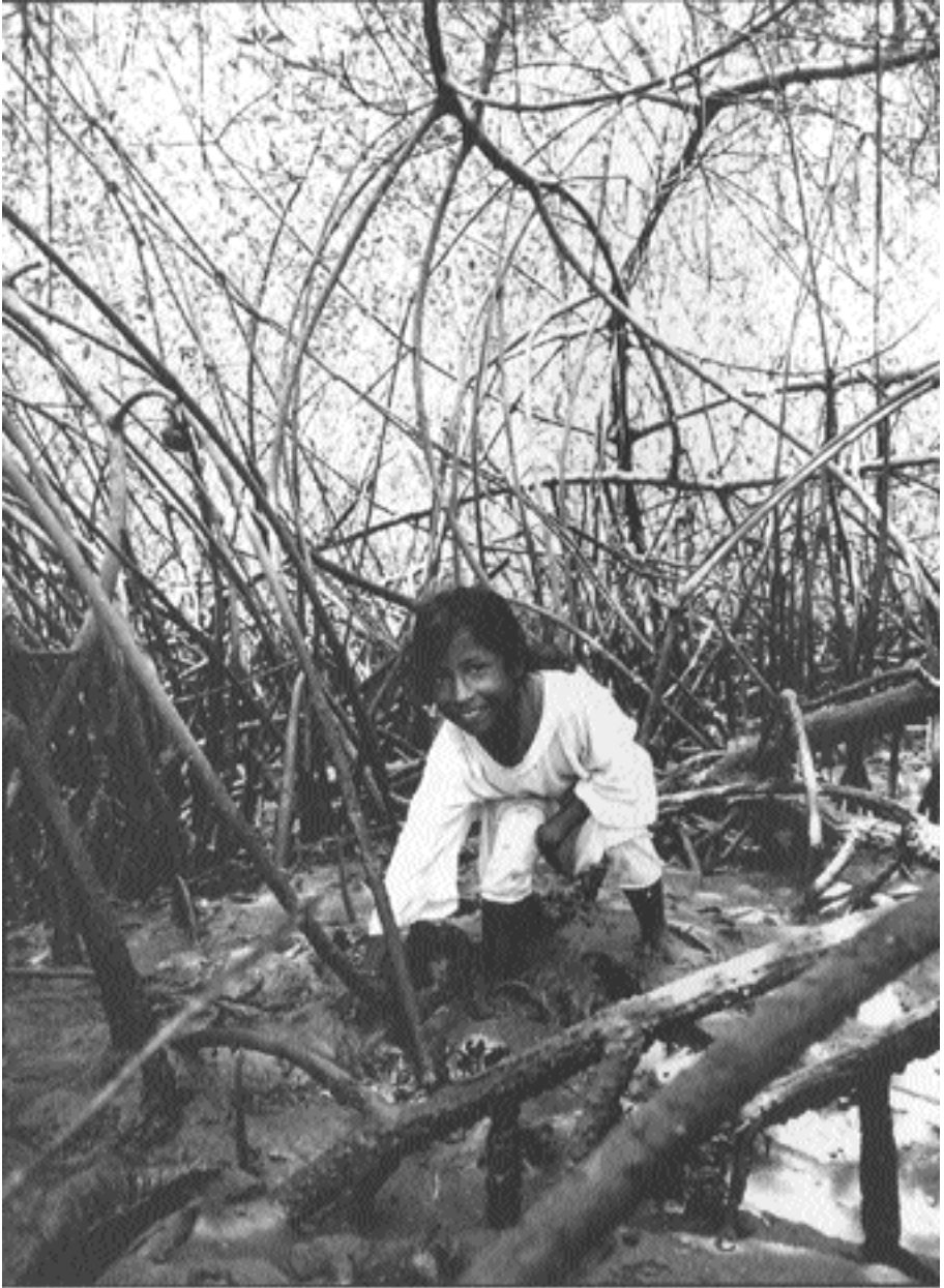
Niña usando el manglar de manera adecuada y comunitaria. Congal, Esmeraldas