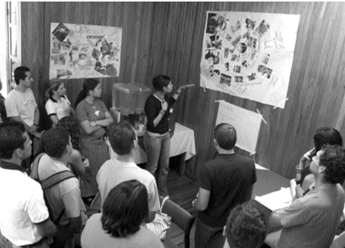
Encuentro de Jóvenes Cooperativistas: presentación de resultados de los trabajos grupales. La Catalina, Costa Rica