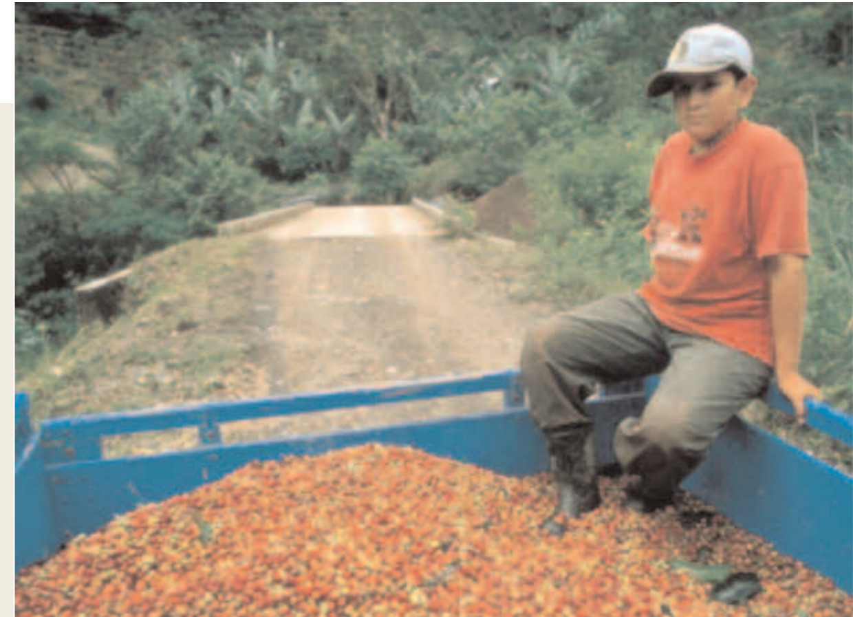
Costa Rica Las Agencias Centroamericanas apoyan fuertemente la producción de café orgánico. En la foto, café de montaña en la Región Brunca

Cuando una Agencia ha alcanzado un buen nivel de funcionamiento, la verificación de los resultados, de las eventuales desviaciones y de sus causas, debe tener por lo menos un vencimiento anual y debe ser conducida en términos de eficacia y eficiencia. Conducir una verificación en términos de eficacia significa comparar los resultados obtenidos con los objetivos que habían sido propuestos. La diferencia entre objetivos y resultados alcanzados indica muy bien la eficacia de la Agencia. Por el contrario, la verificación en términos de eficiencia está ligada a la evaluación de los costos frente a los objetivos alcan-