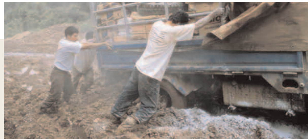
Guatemala Entre los proyectos de impacto de la Agencia de Ixcán, adquieren particular importancia los dedicados a mejorar las vías de comunicación.

Finalmente, en lo que se refiere a la legalización de