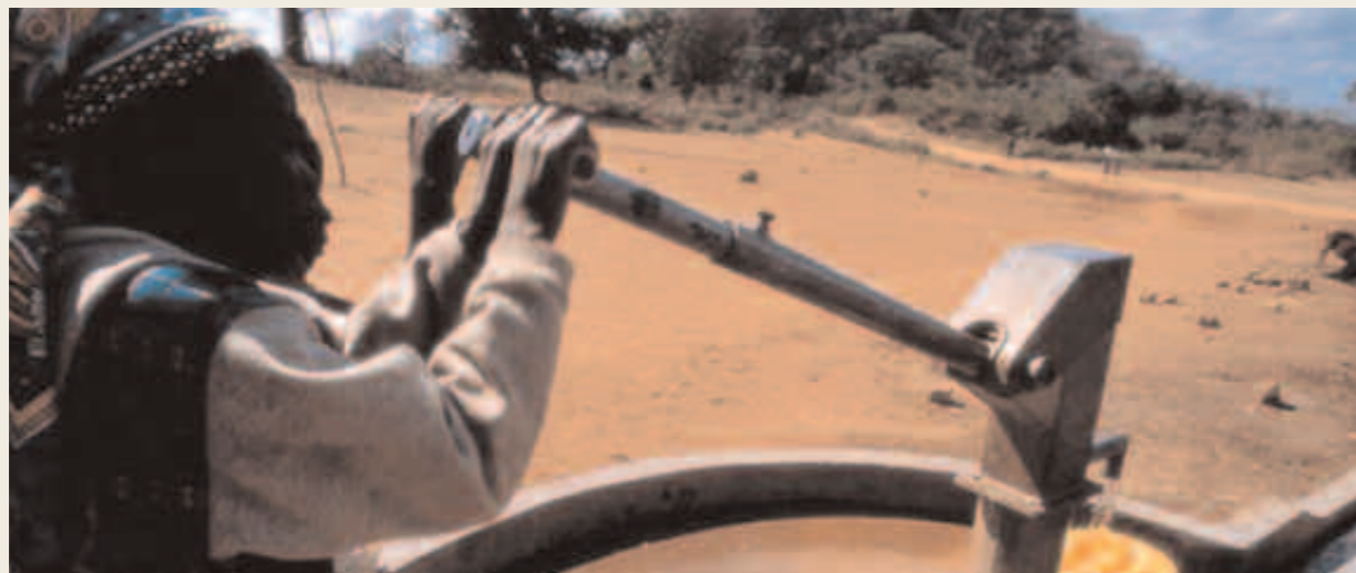
Mozambique Sistema de riego en la provincia de Manica, al norte del país.

ríos. Además, no siempre resultan fáciles las comunicaciones telefónicas. En estos casos el problema de la Agencia es lograr llegar a las poblaciones que viven en estas zonas aisladas para asegurarles también a ellas los mismos servicios que se garantizan en las áreas centrales, y el instrumento es justamente las Ventanillas, donde personal especialmente capacitado ofrece toda una gama de servicios más o menos amplios, en dependencia de las condiciones de comunicación con la sede central. Los servicios abarcan desde los de información elemental y orientación, en los casos en los que el problema es la lejanía física, hasta los de asistencia técnica para la identificación y formulación de proyectos, en los casos de casi completa incomunicación temporal. El personal de las Ventanillas puede depender directamente de la Agencia o ser destinado para esta fun-