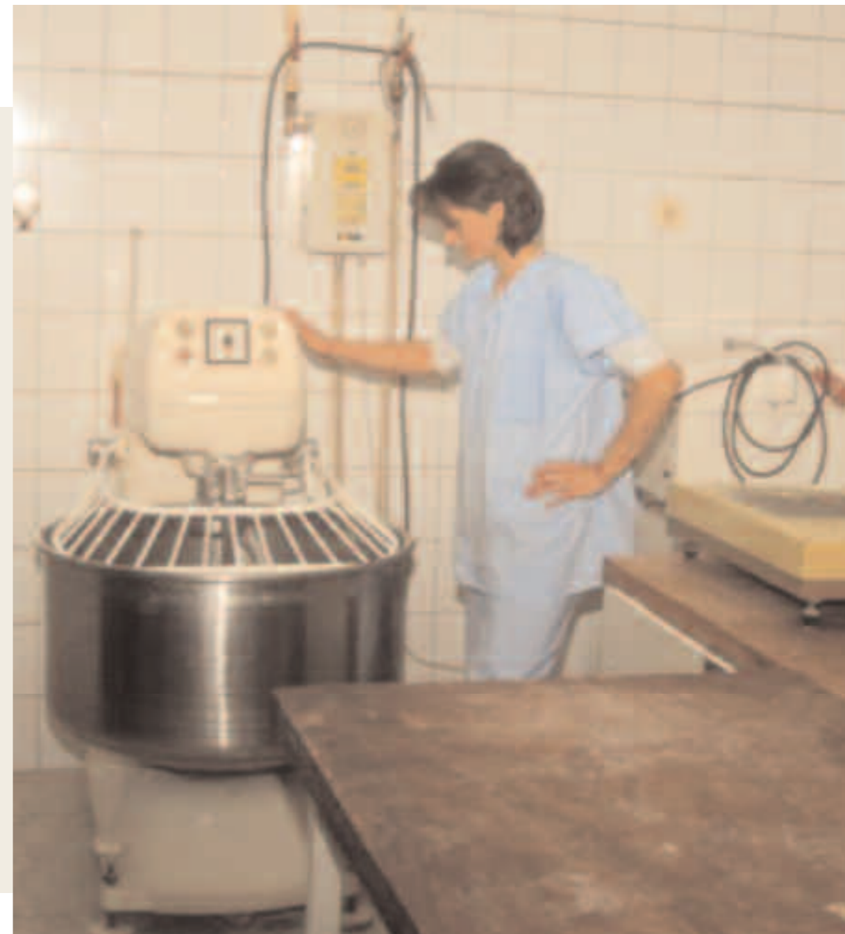
Bosnia Herzegovina Una empresa de productos lácteos financiada por la Agencia del Cantón de Travnik.

Estas actividades constituyen instrumentos clásicos de asistencia a las empresas y tienen la característica