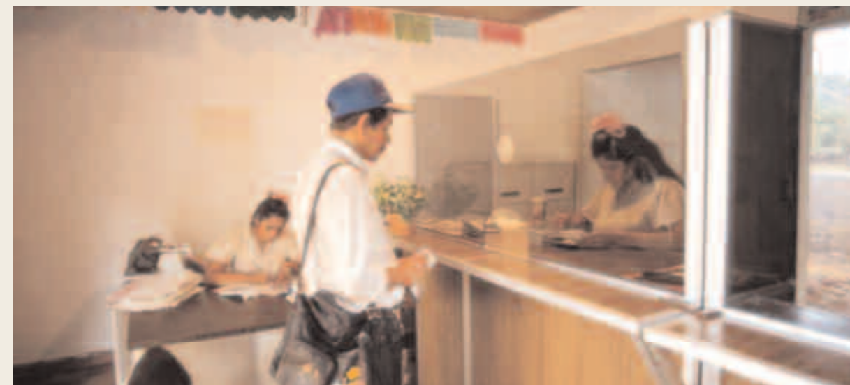
El Salvador Ventanilla de una asociación cooperativa de crédito, ahorro y servicios para la agricultura promovida por la Agencia de desarrollo del Departamento de Chalatenango.

El otro aspecto importante por resolver es el de atraer las instituciones financieras hacia territorios caracterizados por una población que en general es considerada “de alto riesgo financiero”. Ciertamente no se trata de lograr convencer a los bancos de que desarrollen un sentido social, sino de convencerlos de que el pequeño crédito es una operación que puede resultar rentable y atractiva. Para lograr esto es preciso que el territorio disponga de un instrumento capaz de suscitar el interés y la confianza de las instituciones financieras. Un instrumento de mediación que conozca a la población, las potencialidades del territorio y las actividades productivas comunes que allí se desarrollan. Es necesario también que este instrumento disponga de sus propios recursos para la inversión. Ganándose la confianza de los bancos, una Agencia permite ofrecer oportunidades financieras también a aquellos pequeños, potenciales sujetos de crédito que, normalmente, no tienen en su haber una historia comercial y por tanto no son reconocidos por los bancos como clientes. Instrumentos como los fondos de garantía, adoptados por las Agencias, han resultado particularmente apropiados para generar la confianza de los bancos, ampliar la cobertura de las actividades crediticias e incrementar la rentabilidad de las pequeñas operaciones. Cuadro 3