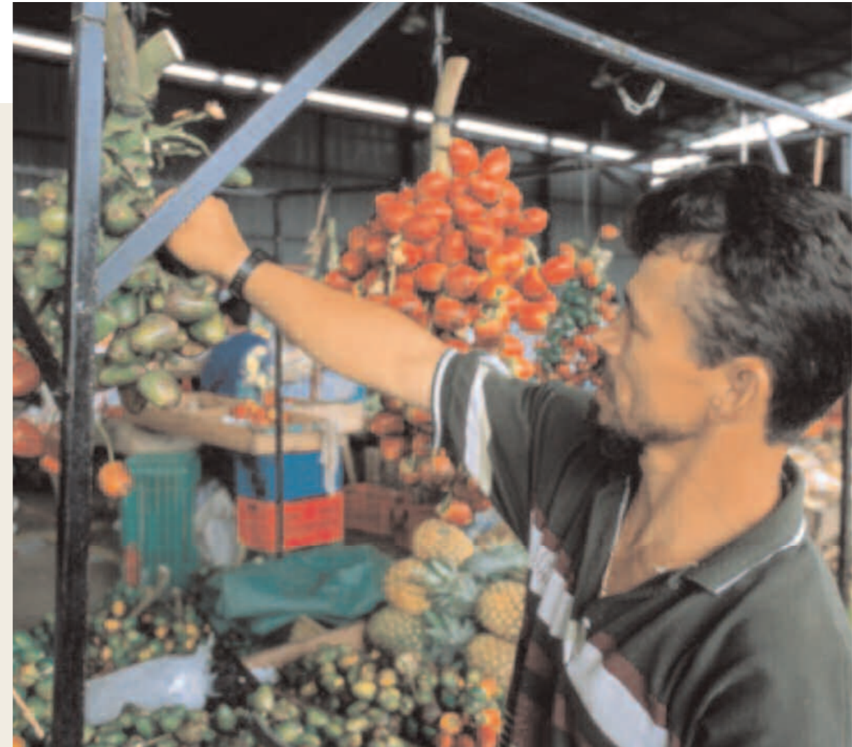
Costa Rica Exposición de fruta cultivada con métodos biológicos en la feria del mercado de Pérez Zeledón

limitarse a promover “cualquier” empresa. Ya sea propuesta por empresarios locales, ya por inversionistas extranjeros, utilice o no los recursos del lugar, siempre y cuando tenga los requisitos de mercado,