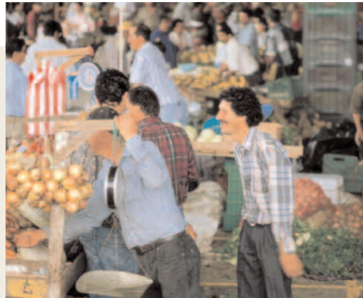
Costa Rica El mercado de Pérez Zeledón promovido por la Agencia de desarrollo local

Es justamente del capital que constituye el Fondo de crédito de donde deriva la primera y más importante forma de sostenibilidad financiera de la Agencia. En efecto, este Fondo genera intereses que son utilizados para el mantenimiento de las actividades de base de la estructura. Generalmente los primeros recursos invertidos para activar una Agencia, incluyendo su Fondo de crédito, son suministrados por los organismos de cooperación internacional, pero