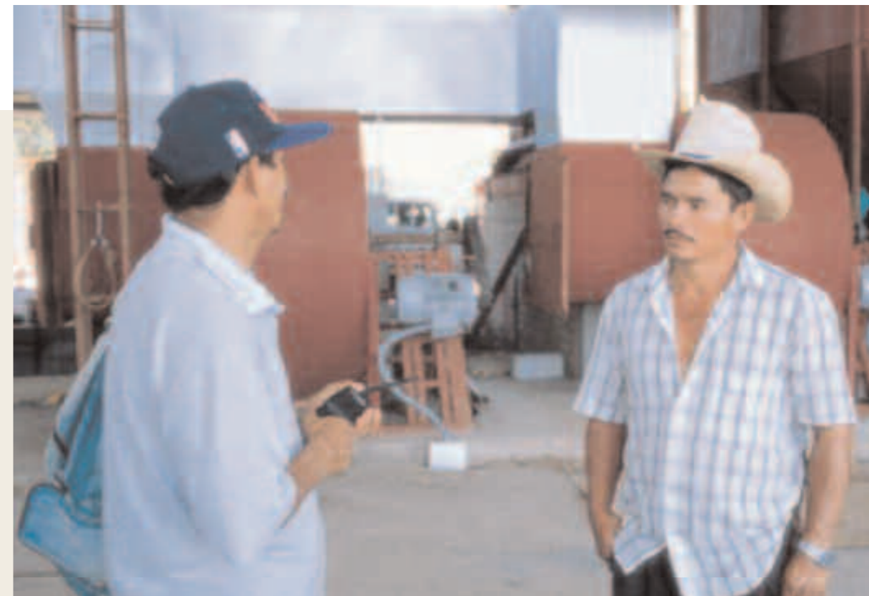
El Salvador Interior de una instalación para el almacenamiento y torrefacción de café, apoyada por la Agencia de Morazán y por las cooperativas de pequeños productores locales.

Generalmente se confía la formulación de los procedimientos al Director Técnico, que es la