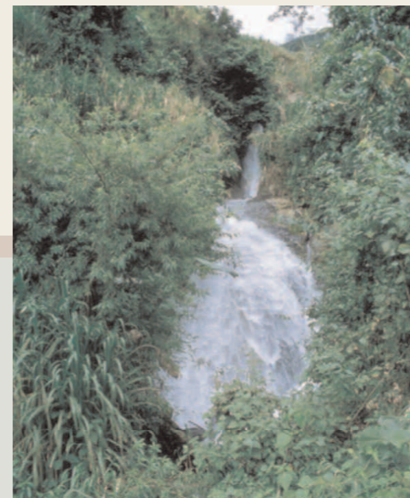
El estudio de factibilidad del proyecto está en curso y, coherentemente con la filosofía del "Programa del Hermanamiento", deberá sentar las bases para una relación

boración con universidades interesadas y con asociaciones calificadas - períodos de capacitación, para recién graduados de los países occidentales, en las Agencias de la Red. Estos cursos arrojan un doble resultado, ya que les permiten a jóvenes economistas adquirir una experiencia práctica sobre temas del desarrollo económico local y, simultáneamente, ponen a disposición de las Agencias recursos técnicos actualizados y competentes.