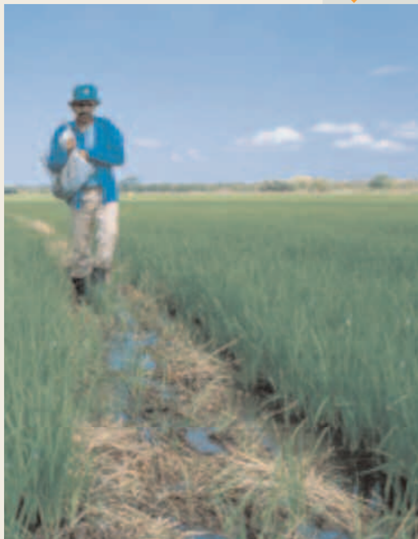
Nicaragua Cultivo de arroz apoyado por la Agencia del Departamento de León.

Una forma original de financiamiento del Fondo de crédito de una Agencia, experimentada en América Central, consiste en la utilización de fondos de contrapartida provenientes de la donación de ayudas alimentarias o de otros bienes.