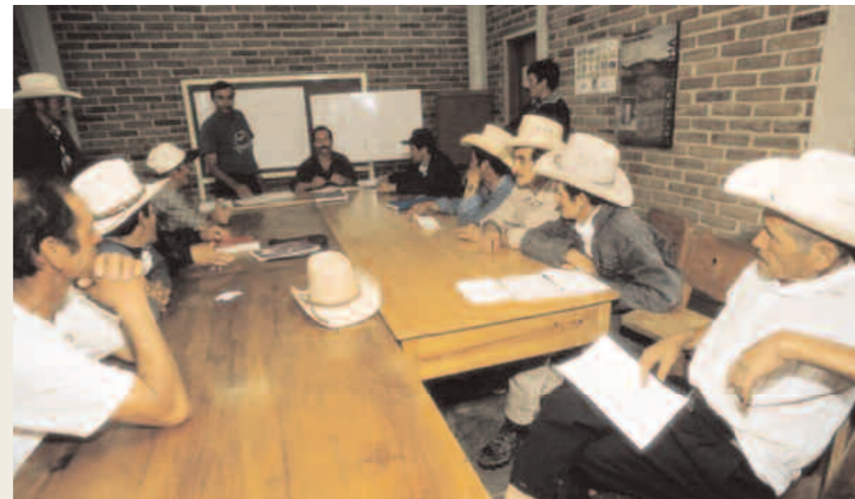
El Salvador La sede de una cooperativa de ahorro y crédito, promovida por la Agencia del Departamento de Morazán

Por estas razones la Agencia no serviría de mucho si ayudara a la gente a formular proyectos de empresa sin intervenir en el problema de su financiación. Uno de los factores de éxito y sostenibilidad de las Agencias es justamente la aportación de un fondo