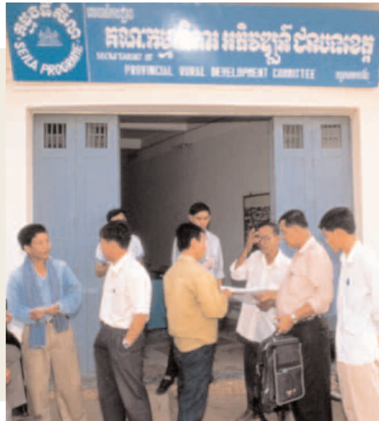
Cambodia La sede de una de las 9 Agencias provinciales de desarrollo económico, promovidas por la OIT en el inicio de los años 90.

En los países industrializados existen diferentes experiencias de Agencias sólo públicas, o compuestas solamente por el sector privado. Estas fórmulas, sin embargo, presentan inconvenientes que limitan el funcionamiento óptimo de la estructura, sobre todo cuando se trata de aplicarlas en los países en vías de desarrollo o en los países en transición hacia una economía de mercado. Es claro que las Agencias totalmente públicas tienen la ventaja de estar plenamente legitimadas por los gobiernos centrales y locales, como instrumento operativo para canalizar fondos y aplicar las propias políticas de desarrollo económico. Pero su desventaja reside en la burocratización y en la escasa participación de la población, que no sigue las orientaciones y tiende a no restituir los créditos. Las políticas de reducción del gasto público, además, hacen estas fórmulas difícilmente aplicables a los países en vías de desarrollo. Las Agencias privadas tienen a menudo la capacidad de coordinar los recursos vivos del territorio y se preocupan de la sostenibilidad de las empresas y de la devolución de los créditos. Su desventaja estriba en el aislamiento respecto de las políticas de los go-