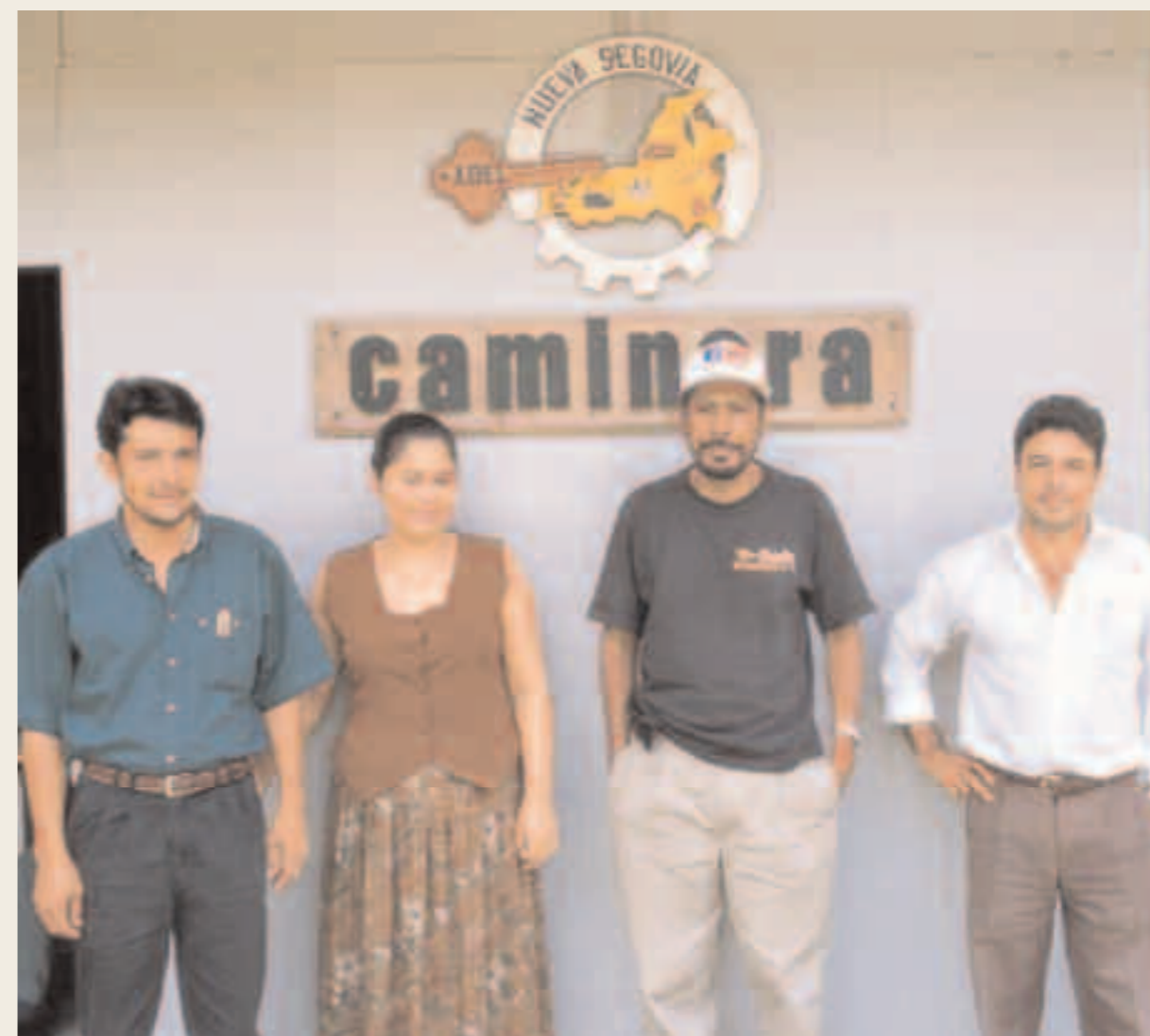
Nicaragua En el Departamento de Nueva Segovia la Agencia de Desarrollo promovió la creación de una empresa para el mejoramiento y mantenimiento de la red de carreteras intermunicipal.

trabajaban por cuenta propia, y, para proteger ulteriormente sus intereses, ha solicitado y obtenido del Gobierno el permiso para la explotación de 12.710 hectáreas de los Municipios de Murra y Jícaro. Ha posibilitado también la capacitación de los cooperativistas y suministra asistencia técnica para modernizar los tradicionales métodos de extracción, con el fin de que la iniciativa fuera más rentable. Ya con estos primeros apoyos, la cooperativa "El Diamante" pudo mejorar sensiblemente sus actividades de extracción de oro. Pero la Agencia continuó trabajando para valorizar ulteriormente el proyecto: intensificó la exploración geológica para identificar con mayor precisión la zona de potencial explotación, 127 kilómetros cuadrados; localizó tres joyerías nacionales interesadas en adquirir el oro. En fin la Agencia presentó el proyecto a la cooperación austríaca y en mayo de 1996 firmó con ADC-Austria un contrato de cooperación técnica y financiera. En 1997 esta iniciativa atrajo también la atención de una sociedad privada canadiense, la ARCHON, con la cual la Agencia en el curso del año firmó un acuerdo de colaboración para la explotación de la mina.