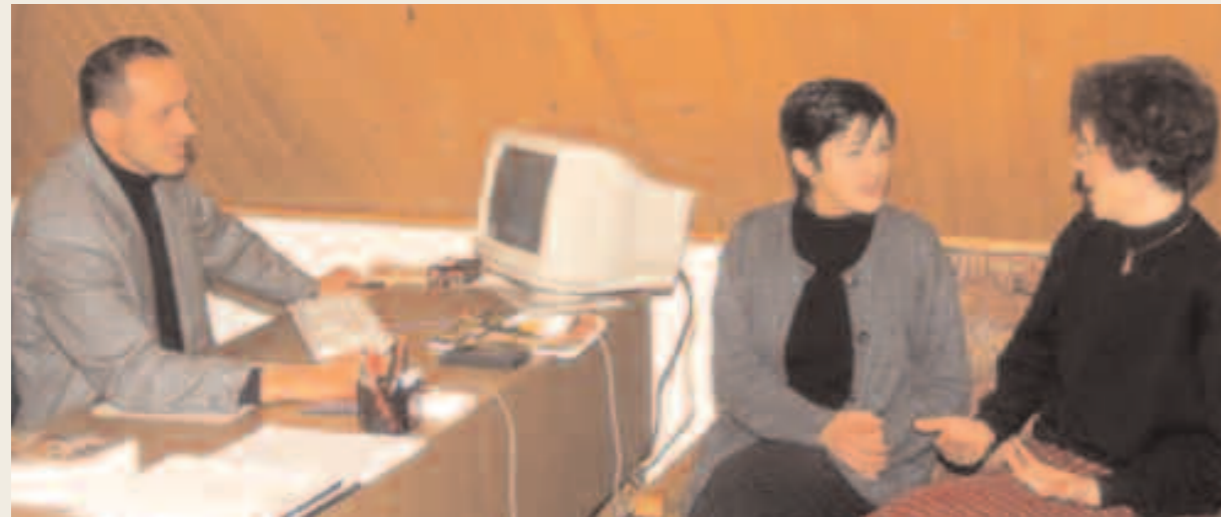
Bosnia Herzegovina Parte del equipo técnico de la Agencia del Cantón de Travnik (CEBEDA).

Para alcanzar sus objetivos, la Agencia lleva a cabo diferentes funciones que se ubican en tres áreas estratégicas: el mejoramiento del contexto de referencia, la animación económica y el soporte empresarial.