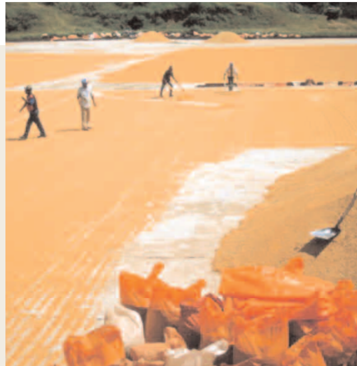
Nicaragua El centro de almacenamiento y comercialización de productos agrícolas, promovido por la Agencia del Departamento de Nueva Segovia.

También las actividades de planificación tienen una gran importancia, no sólo para potenciar el desarrollo local, sino también, indirectamente, para reforzar el papel de la estructura en el territorio. La Agencia, suministrando contra pago servicios de “planificación” y mediación para inversionistas potenciales, podrá mejorar sus propias condiciones financieras y operativas. Ejemplos significativos de estas funciones están representadas por el papel desempeñado por las Agencias de América Central en la formulación de proyectos de reconstrucción de las economías locales por el paso del huracán