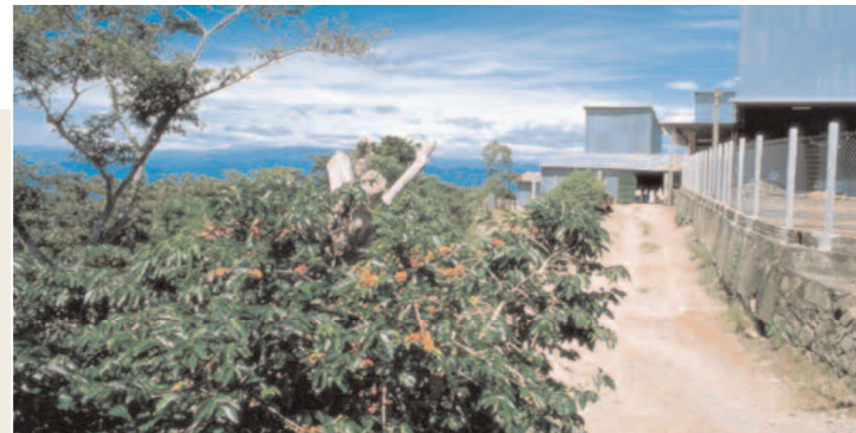
El Salvador Departamento de Morazán: Centro de recolección de café de las cooperativas agrícolas. La Agencia de Morazán apoya fuertemente estas cooperativas.

Un segundo aspecto significativo es que el superávit generado localmente no siempre llega a los circuitos financieros administrados por los bancos. En efecto, hasta los habitantes más pobres desarrollan diferentes formas de ahorro, que siguen modelos tradicionales caracterizados por una gran prudencia. El problema a resolver, en este caso, es la progresiva transformación de las formas tradicionales de ahorro en mecanismos que permitan la transferencia de los superávits a otras personas del lugar, que necesitan recursos adicionales para poner en marcha nuevas inversiones. Pero las personas en condiciones de pobreza difícilmente asumen el riesgo de confiar sus ahorros a un organismo al que no le tengan la más absoluta confianza. Se tratará, por lo tanto, de crear un sistema local que sea socialmente creíble, defienda los intereses de los pequeños ahorradores, promueva formas de ahorro monetario, permita captar el superávit en el territorio y lo redistribuya localmente a través del crédito.