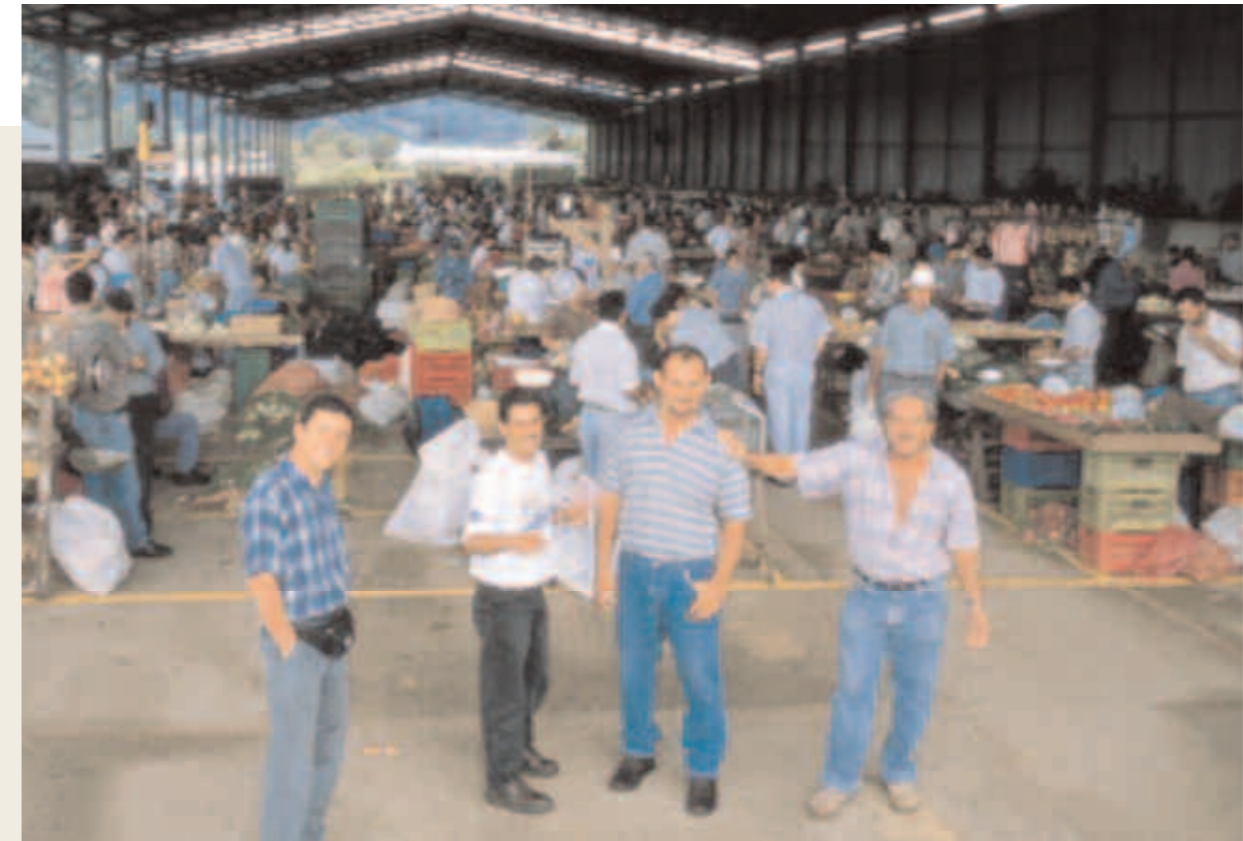
Costa Rica Pequeños productores socios de la feria del mercado de Pérez Zeledón, promovida por la Agencia local.

La sostenibilidad sociopolítica depende ante todo de la medida en que los actores locales se hayan apropiado de la Agencia. Las organizaciones que forman parte de ella, así como el personal de la