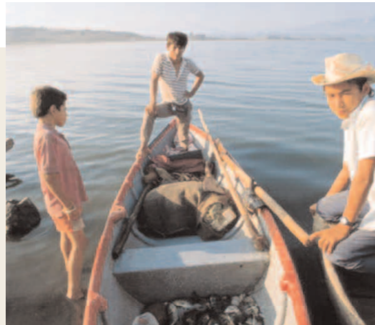
El Salvador El lago artificial producido por el dique del Río Lempa en el Departamento de Chalatenango. Aquí se produce casi toda la energía eléctrica del país.

Una fuente interesante de recursos técnicos especializados en la formulación de proyectos complejos lo son las alianzas con Agencias de países industrializados o con colectividades locales de estos países empeñadas en la cooperación descentralizada. Un ejemplo significativo fue ofrecido por el Municipio