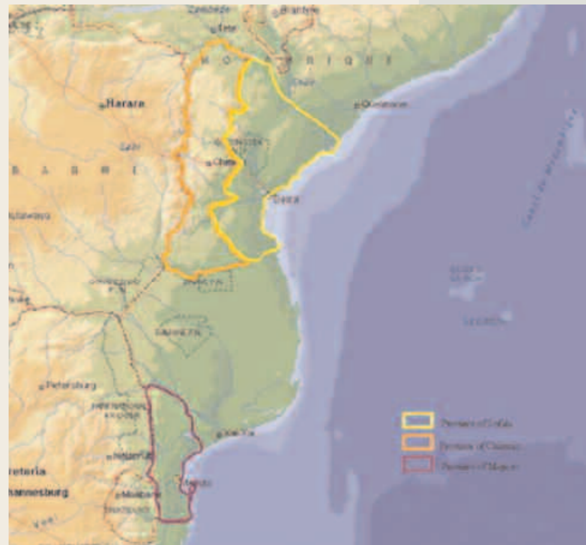
Mozambique Se destacan las tres Provincias en las cuales se están creando las Agencias de Desarrollo.

El objetivo principal de la estrategia es la identificación de los sectores con mejores perspectivas y simultáneamente de los factores importantes que limitan las potencialidades de la economía local. Conviene recordar que los recursos a disposición de la Agencia suelen ser relativamente limitados, por lo cual es necesario definir cuáles intervenciones son prioritarias para ofrecer un elevado valor agregado a toda la economía local. Para seleccionar las prioridades, se toman en consideración las potencialidades, es decir, los sectores más dinámicos y simultáneamente las necesidades más manifiestas de la población que, generalmente, indican también los límites y los problemas del desarrollo local.