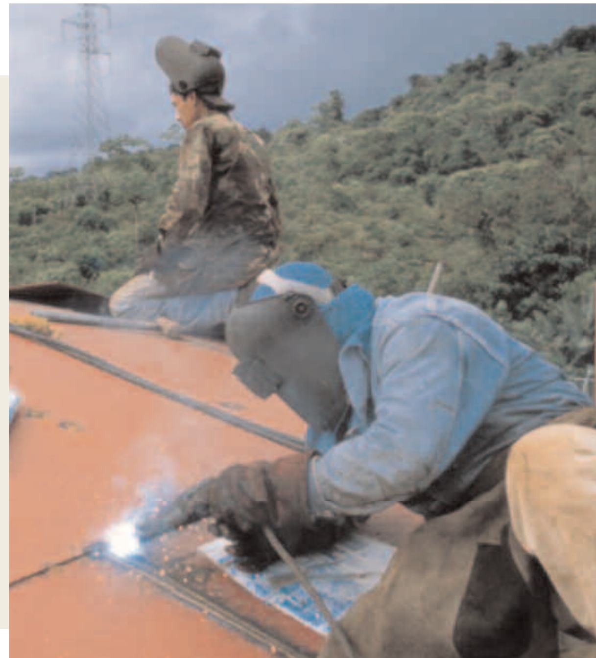
Costa Rica Establecimiento para la producción de aceite de palma, en construcción en el Cantón de Pérez Zeledón.

La evaluación, sin duda, no puede ser solamente cuantitativa, porque la ocupación generada depende de diferentes variables. Una primera variable significativa está representada por la consistencia del capital para actividades de crédito del cual dispone o al cual puede recurrir. Una Agencia dotada de un fondo de crédito de 800,000 dólares tendrá seguramente un impacto ocupacional superior al de una Agen-