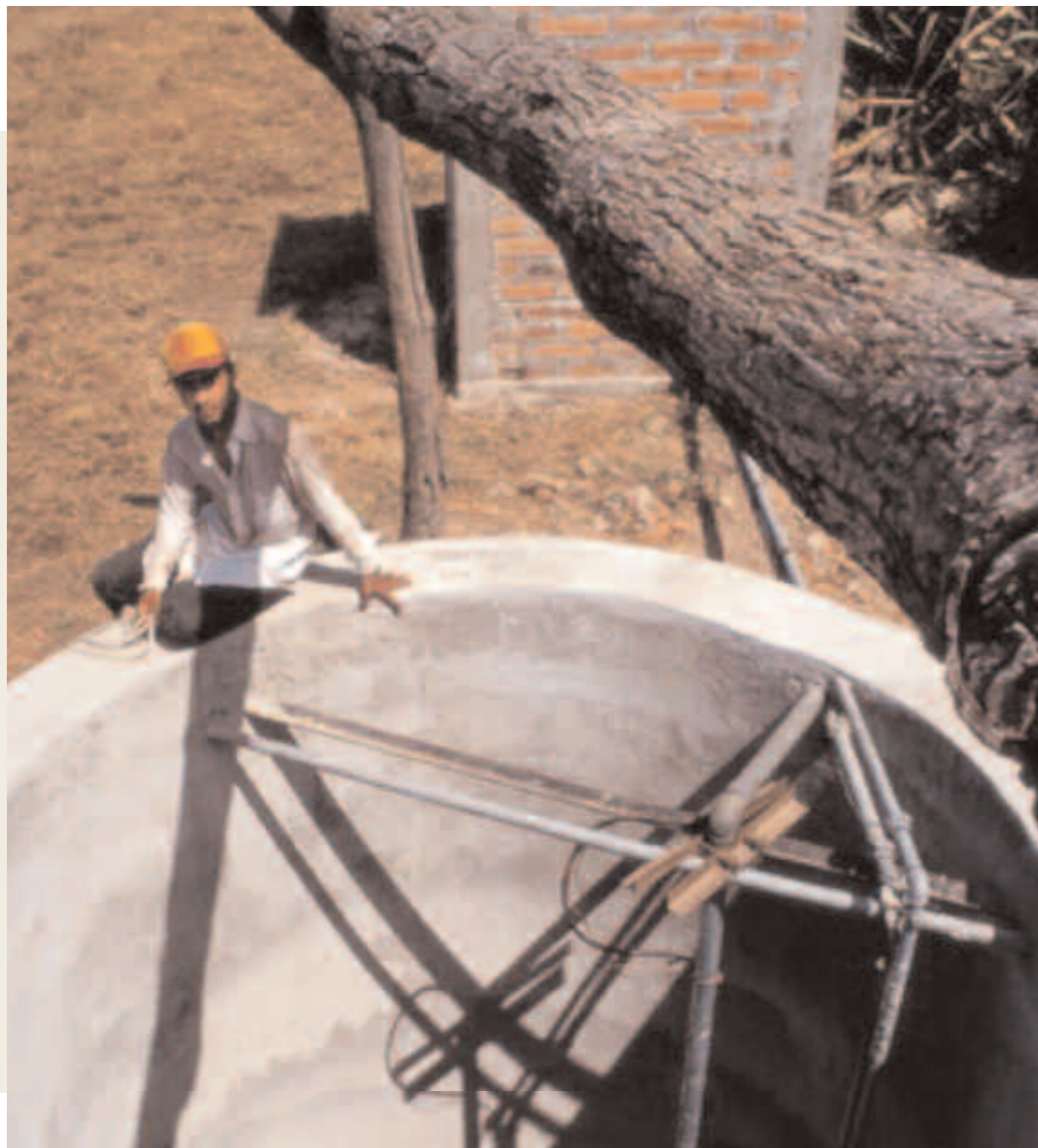
El Salvador Construcción de pozos para reforzar las redes de irrigación del Departamento de Chalatenango.

puntuales, pueden ser delegadas a organizaciones o profesionales externos guiados por la Agencia. Es el caso, por ejemplo, de estudios de mercados específicos, estudios de factibilidad, consultas jurídicas u otras prestaciones puntuales necesarias para la realización de proyectos concretos.